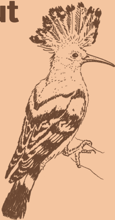
Fig. 4 Puput Upupa epops “pu-pu-pú”

Festival de Cançons de tradició oral Cassà de la Selva, del 16 al 18 de novembre de 2018 www.cantut.cat